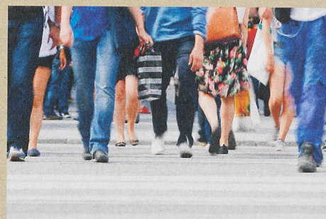
Chacun de nos pas crée une vibration dans le sol qui peut être détectée et mesurée.