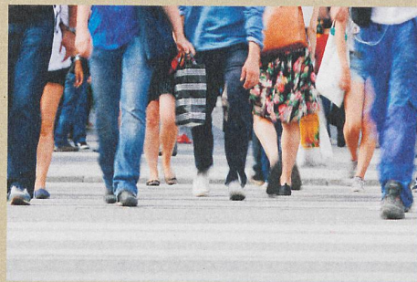
Chacun de nos pas crée une vibration dans le sol qui peut être détectée et mesurée.