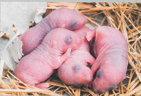
Le système immunitaire d'un souriceau est déjà entraîné avant la naissance.

S. C. Ganai-Vonarburg et al.: Maternal microbiota and antibodies as advocates of neonatal health. Gut Microbes (2017)