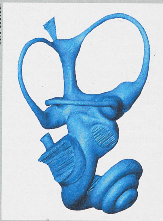
La reconstruction de l'oreille interne d'un fœtus de vache témoigne de l'évolution des ruminants.