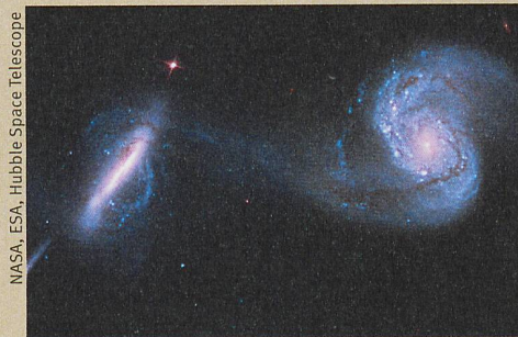
Des trous noirs supermassifs peuvent naître de la rencontre de deux galaxies.