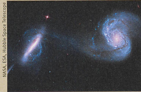
Des trous noirs supermassifs peuvent naître de la rencontre de deux galaxies.