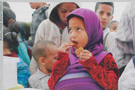
Un aliment sain et apprécié: les biscuits enrichis au fer.

R. R. Bouhouch et al.: Effects of wheat-flour biscuits fortified with iron and EDTA, alone and in combination, on blood lead concentration, iron status, and cognition in children: a double-blind randomized controlled trial. The American Journal of Clinical Nutrition (2016)