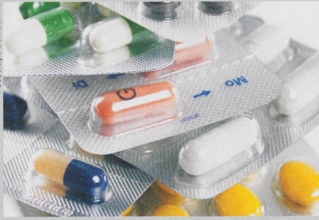
Trop de médecins et de remèdes différents augmentent les risques liés aux effets secondaires.