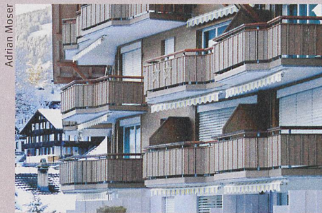
Evolution inattendue: le prix des résidences principales a diminué dans les régions touristiques.

Le programme atteint les adolescents par SMS au moment où ils boivent: en sortie.