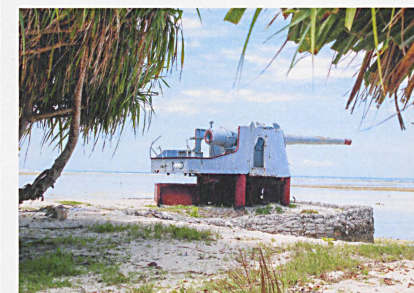
Les habitants de l'atoll de Tarawa dans la République des Kiribati peuvent encore jouer au football. Mais si le niveau de la mer continue de monter, l'anglais parlé localement constituera un vestige plus durable de l'ère coloniale que les canons posés sur la plage pendant la guerre du Pacifique.