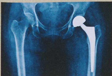
Les prothèses de hanche s'infectent parfois. Un revêtement de nanosphères pourrait aider.

M. Priebe et al.: Antimicrobial silver-filled silica nanorattles with low immunotoxicity in dendritic cells. Nanomedicine (2016)