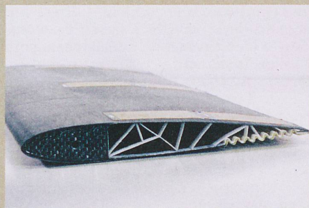
L'aile déformable de l'ETH Zurich agit comme un aileron avec une résistance de l'air réduite.

G. Molinari et al.: Aerostructural Performance of Distributed Compliance Morphing Wings: Wind Tunnel and Flight Testing. AIAA Journal (2016)