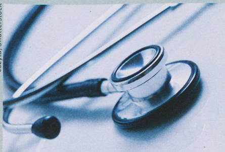
Une bonne auscultation au stéthoscope active différentes zones du cerveau du praticien.

R. De Meo et al.: What makes medical students better listener? Current Biology (2016)