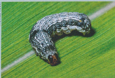
En cas d'attaque, une plante doit pouvoir gérer son stock d'insecticides.