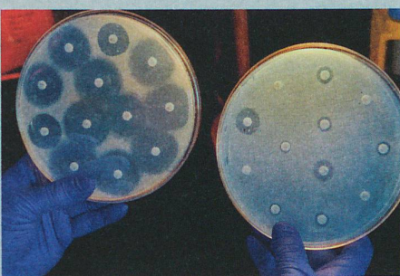
Des bactéries multirésistantes (à droite) tiennent en échec un nombre croissant d'antibiotiques.