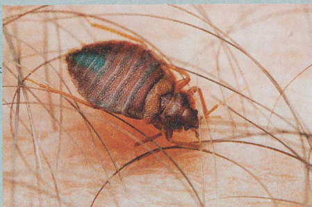
Des compagnons de lit peu appréciés qui développent des résistances.