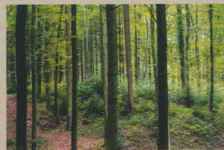
Les feuillus tels que les hêtres profiteront du changement climatique.

N. Bircher: To die or not to die: Forest dynamics in Switzerland under climate change. Ph.D. Thesis, ETH Zurich (2015)