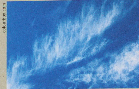
Situés hauts dans le ciel, les cirrus laissent passer les rayons solaires.