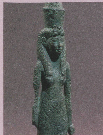
Parfois lionne, parfois vautour, ici humaine: Mout, déesse dangereuse mais populaire.