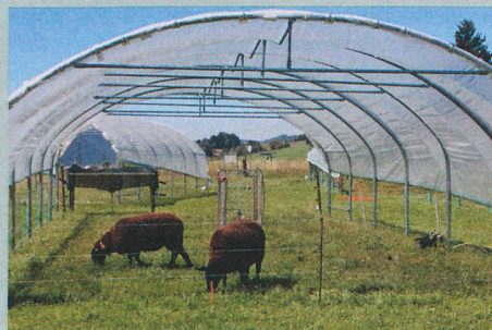
Les chercheurs ont simulé un été sec grâce à ce tunnel maraîcher.

C. Deléglise et al.: Drought-induced shifts in plants traits, yields and nutritive value under realistic grazing and mowing managements in a mountain grassland. Agriculture, Ecosystems & Environment (2015)