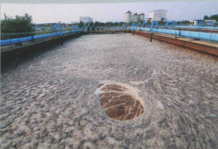
Un terreau fertile pour les bactéries résistantes aux antibiotiques.

B. Ricken et al.: Degradation of sulfonamide antibiotics by Microbacterium sp. strain BR1 – elucidating the downstream pathway. New Biotechnology (2015)