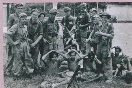
Des soldats néerlandais posent sur l'île de Java avec des prisonniers de guerre.

R. Limpach: Business as usual: Dutch mass violence in the Indonesian war of independence 1945–49, in: B. Luttikhuis et al. (Eds.): Colonial Counterinsurgency as Mass Violence. The Dutch Empire in Indonesia. Routledge, New York, 2014