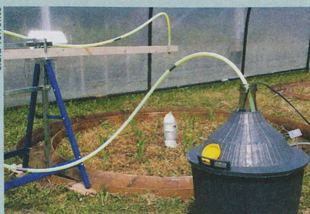
Les polluants qui s'infiltrent dans le sol sont collectés et analysés.