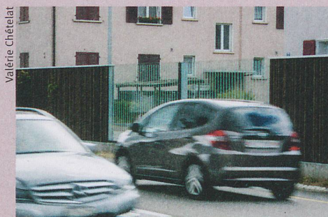
La norme sociale pourrait encourager la conduite silencieuse.