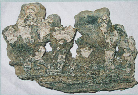
Des bactéries ont fabriqué ces stromatolithes, des formations calcaires.