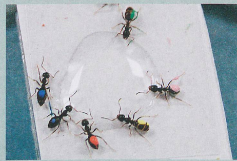
Identifiés par une marque de couleur, les insectes ont trouvé la nourriture.