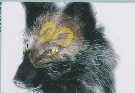
Le stress est régulé par l'hippocampe, également chez les renards apprivoisés.