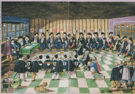
La Diète fédérale de Baden en 1531 (illustration tirée d'une œuvre de A. Ryff, 1597).