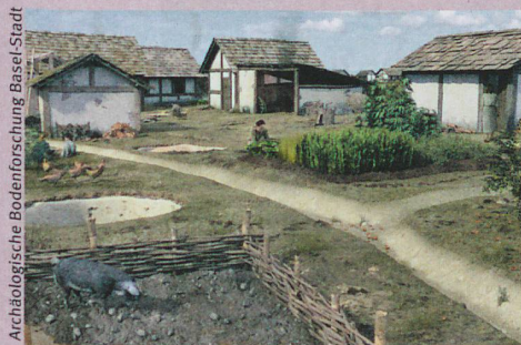
Reconstruction de la cité celtique bâloise datant de 100 av. J.-C. environ.