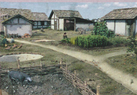
Reconstruction de la cité celte bâloise datant de 100 av. J.-C. environ.

Archäologische Bodenforschung Basel-Stadt