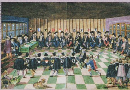
La Diète fédérale de Baden en 1531 (illustration tirée d'une œuvre de A. Ryff, 1597).