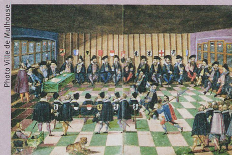
La Diète fédérale de Baden en 1531 (illustration tirée d'une œuvre de A. Ryff, 1597).