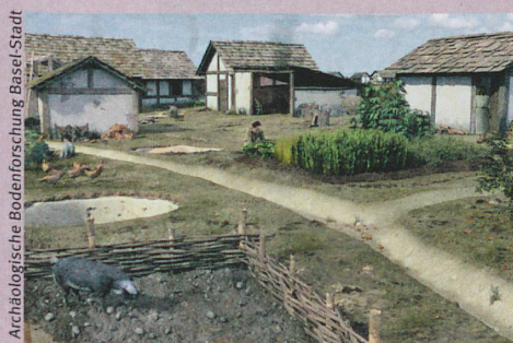
Reconstruction de la cité celtique bâloise datant de 100 av. J.-C. environ.