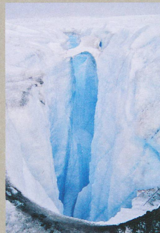
De l'eau de fonte s'infiltré depuis la surface jusqu'à la base du glacier.