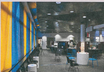
La salle d'attente transformée du Contrôle des habitants de la Ville de Berne.