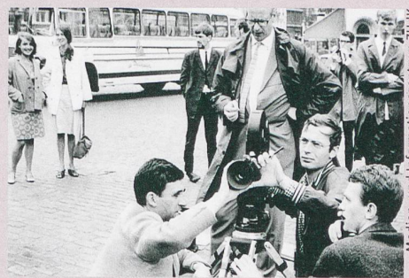
Des étudiants suisses en cinéma apprenant les ficelles du métier à la fin des années soixante.

Thomas Schärer: Zwischen Gotthelf und Godard. Erinnernte Schweizer Filmgeschichte 1958–1979 . Limmat Verlag, Zurich 2014, 701 p.