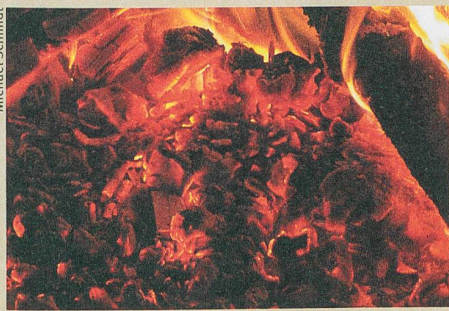
Même les résidus de bois brûlé les plus fins sont riches d'enseignement.