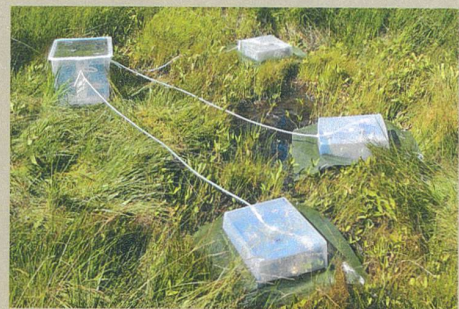
Pièges à métaux lourds installés dans le cadre d'une expérience au Tessin.