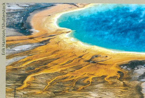
Les traces marquantes de la présence d'un supervolcan dans le parc national de Yellowstone.

W. J. Malfait et al. (2014): Supervolcano eruptions driven by melt buoyancy in large silicic magma chambers. Nature Geoscience , vol. 7(2):122-125.