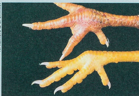
La patte de poulet en haut appartient à un animal atteint par la grippe aviaire.