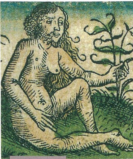
Culture et société

Nouveau senseur pour mesurer l'état des océans Comment faire parler les supervolcans Dangereuses zones humides