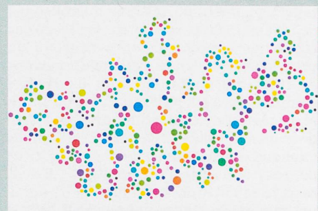
Représentation symbolique des processus métaboliques chez des bactéries virtuelles.

A. Barve & A. Wagner (2013): A latent capacity for evolutionary innovation through exaptation in metabolic systems . Nature 500: 203-206.