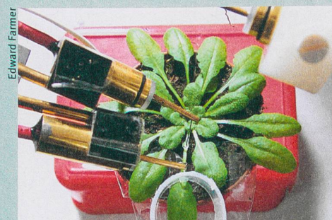
Les électrodes mesurent les signaux électriques de l'arabette des dames.

S. A. R. Mousavi, A. Chauvin, F. Pascaud et al. (2013): GLUTAMATE RECEPTOR-LIKE genes mediate leaf-to-leaf wound signaling . Nature 500: 422-426.