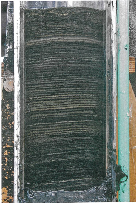
Carotte de sédiments du fond du lac de Greifen. Les différentes couches permettent de lire le passé.

Les puces d'eau, ou daphnies, mesurent un à deux millimètres. Elles comptent parmi les plus petites espèces de nos lacs, mais leur importance est majeure. Présentes par milliards dans les plans d'eau, elles constituent la principale source de nourriture des poissons juvéniles. Des chercheurs ont fait à présent une découverte inquiétante: leur diversité génétique s'est fondamentalement modifiée au cours des cent dernières années. La faute à l'être humain.