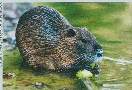
Le rat musqué est également indésirable.

Tim M. Blackburn et al. (2014): A Unified Classification of Alien Species Based on the Magnitude of their Environmental Impacts . PLoS Biology 12: e1001850.