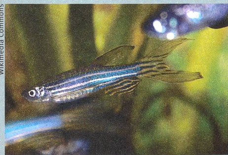
Le poisson zèbre est capable de régénérer son cœur après un infarctus.