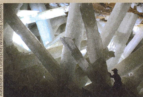
Spectaculaires cristaux de gypse de la mine mexicaine de Naica.

Y. Krüger, J. M. García-Ruiz, À. Canals, D. Martí, M. Frenz, A.E.S. Van Driessche: Determining gypsum growth temperatures using monophase fluid inclusions – Application to the giant gypsum crystals of Naica, Mexico , dans: Geology (2013), 41, 2, 119–122.