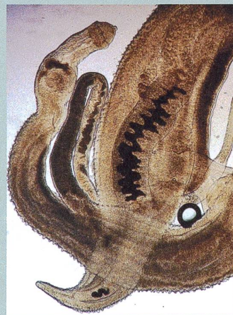
Parasites en action. Des vers à l'origine de la bilharziose.