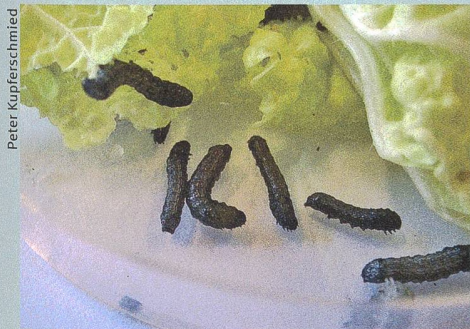
Des chenilles ravageuses ingèrent des feuilles qui ont été traitées avec des bactéries insecticides.