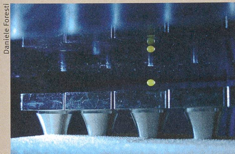
Réaction sans contact. L'acoustophorèse renforce la fluorescence d'un produit chimique (en vert).

D. Foresti, M. Nabavi, M. Klingauf, A. Ferrari, D. Poulikakos (2013): Acoustophoretic contactless transport and handling of matter in air . Proceedings of the National Academy of Sciences of the United States of America (doi:10.1073/pnas.1301860110/-/DCSupplemental).