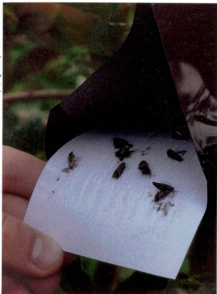
Les pièges à phéromones sont efficaces contre les carpocapses.