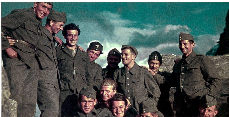
Des soldats suisses à la frontière italienne, en 1940.

« La globalisation se reflète de manière très variée dans la littérature alémanique contemporaine, souligne la germaniste. L'interculturalité a été dotée de nouvelles qualités. La peur de l'étranger, telle que l'a décrite Joseph Conrad dans Au cœur des ténèbres , n'est plus de mise. » Anna Wegelin ■