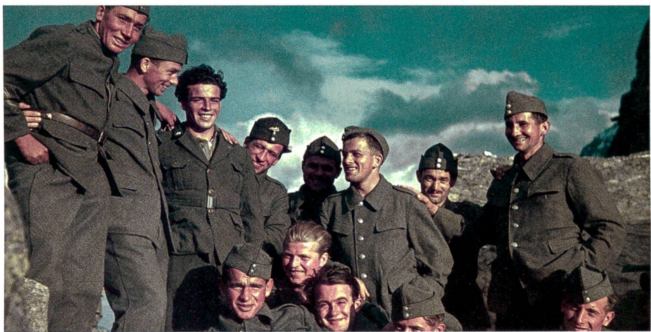
Des soldats suisses à la frontière italienne, en 1940.

« La globalisation se reflète de manière très variée dans la littérature alémanique contemporaine, souligne la germaniste. L'interculturalité a été dotée de nouvelles qualités. La peur de l'étranger, telle que l'a décrite Joseph Conrad dans Au cœur des ténèbres , n'est plus de mise. » Anna Wegelin ■