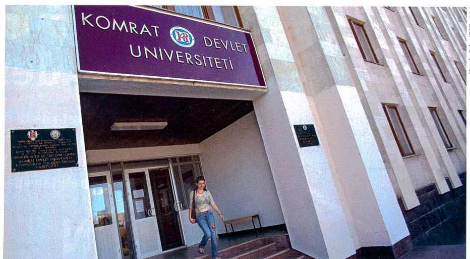
La Moldavie est victime d'une importante fuite des cerveaux. De nombreux chercheurs retourneraient toutefois volontiers dans leur patrie (Université d'Etat de Comrat, 2007).

L'enquête montre que ces derniers cultivent encore des contacts réguliers avec leur patrie. Plus de 40% d'entre eux envoient de l'argent à leur famille pour lui permettre de boucler les fins de mois. Une bonne partie a également déjà mené des projets de recherche communs avec des collègues en Moldavie ou a participé à des congrès dans ce pays. Reste que nombre d'entre eux n'ont tout simplement pas le temps de s'engager davantage. Et ils sont aussi nombreux à estimer que le gouvernement devrait faire plus d'efforts pour la recherche. Une majorité rentrerait volontiers en Moldavie. Compte tenu de la situation financière précaire et des mauvaises infrastructures, peu pensent toutefois y trouver des perspectives professionnelles acceptables. Simon Koechlin ■