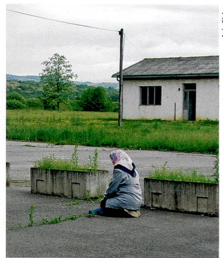
Interrogatoires, viols : le temps du souvenir à Omarska (mai 2005).

fants autistes et l'ont comparée avec celle d'enfants atteints de déficit intellectuel. Résultat : la compréhension des premiers dépasse celle des seconds après une année. Les autistes apprennent l'empathie et peuvent partager l'expérience émotionnelle des autres. « Mais il faut le leur enseigner, car ce n'est pas dans leur intuition », souligne Evelyne Thommen. Ce travail se fait sur deux volets. Le premier, théorique, consiste à leur expliquer ce que sont les émotions, à les définir, à leur montrer comment elles s'expriment. Le second à tirer parti de situations réelles (dispute, chagrin) pour intégrer la théorie. Au final, ils auraient même accès à l'amitié. Fabienne Bogadi