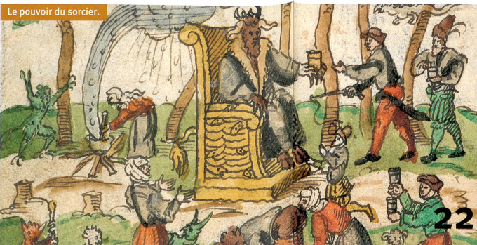
Zentrallbibliothek Zürich, Ms F 19, Bl. 147r

22 Nouveaux lasers au service de la médecine.