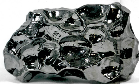
Christian Gouzenbach «Météorite»

6 L'artiste dans le laboratoire ou lorsque l'art et la science se rencontrent.