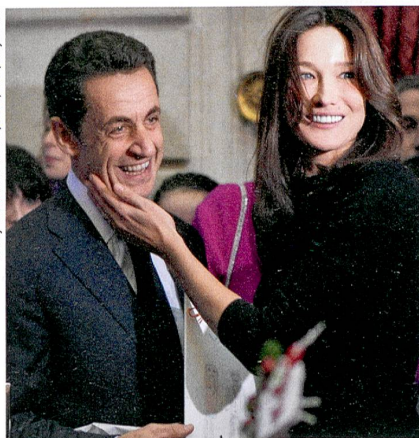
Une relation marquée par le narcissisme ? Nicolas Sarkozy et Carla Bruni-Sarkozy (2009).