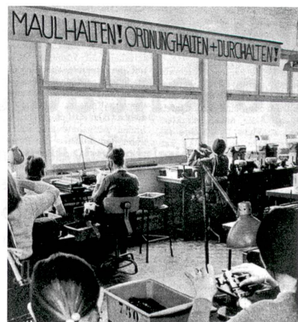
Bien se tenir. Un mot d'ordre très en vogue dans les institutions de placement (institution pour l'éducation des jeunes filles de Lärchenheim, Appenzell Rhodes-Extérieures, 1970).

Natalie Benelli, Nettoyeuse – Comment tenir le coup dans un sale boulot , Éditions Seismo, Zurich, 2011, 218 p.