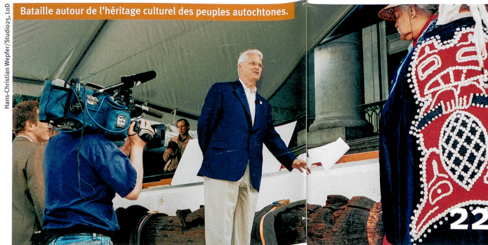
Bataille autour de l'héritage culturel des peuples autochtones.