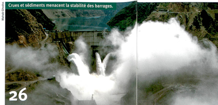
Crues et sédiments menacent la stabilité des barrages.