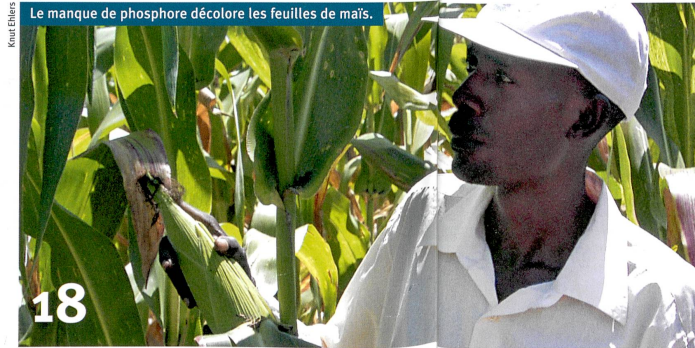
Le manque de phosphore décolore les feuilles de maïs.

6 Le pouvoir de la lumière ou comment le laser influence notre quotidien.