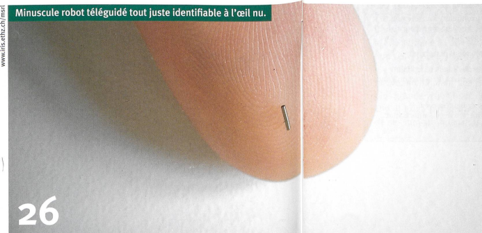
Minuscule robot téléguidé tout juste identifiable à l'œil nu.