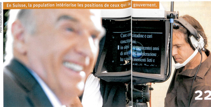
En Suisse, la population infériorise les positions de ceux qui la gouvernent.