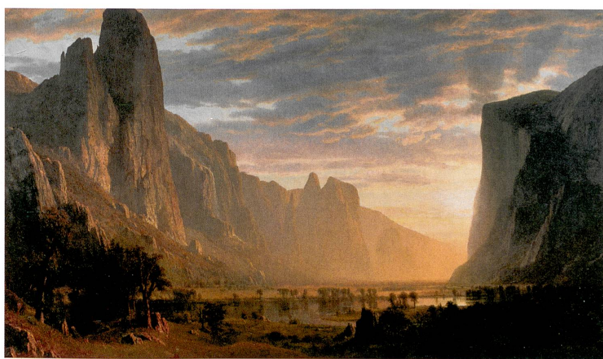
La vallée de Yosemite, un site exceptionnel à la beauté préservée (Albert Bierstadt : « Looking Down Yosemite Valley », 1865).