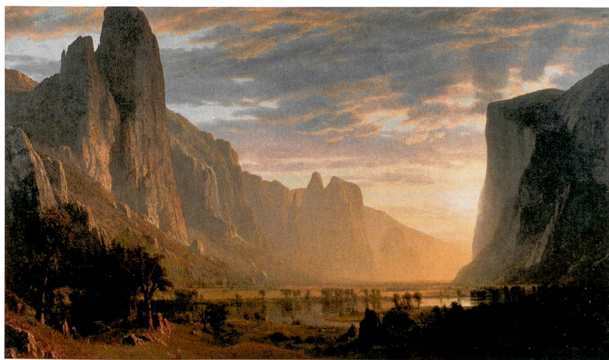
La vallée de Yosemite, un site exceptionnel à la beauté préservée (Albert Bierstadt : « Looking Down Yosemite Valley », 1865).