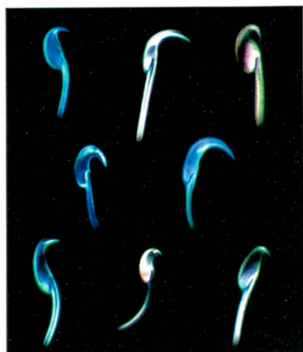
Le crochet à la pointe du spermatozoïde est d'autant plus marqué que le rongeur multiplie les partenaires.

Des millions de spermatozoïdes se livrent une lutte sans merci pour pouvoir féconder un seul ovule. Mais, fait surprenant, dans le règne animal, les spermatozoïdes capables de se solidariser pour atteindre cet objectif sont largement répandus, chez les insectes, les escargots ou l'ornithorynque. Chez de nombreux rongeurs aussi, les spermatozoïdes ont une tête en forme de crochet qui leur permet de s'imbriquer les uns dans les autres pour conjuguer leurs forces dans leur avancée commune. Par groupes de deux et parfois même de cent, ils progressent plus efficacement dans le système reproducteur de la femelle.