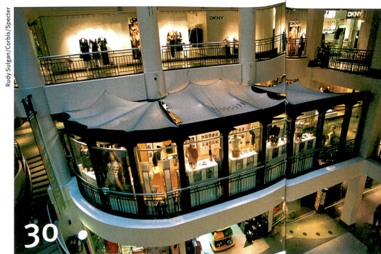
Comment mieux exploiter le sous-sol des villes, à l'exemple de Montréal.