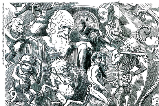
Darwin penseur controversé, ici dans une caricature de 1882.